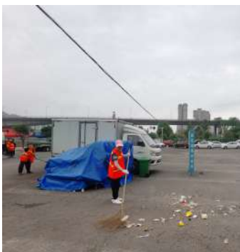
夜市散去，环卫工早上在现场打扫卫生

这个“网红”夜市是去是留？烟火气又如何兼顾文明、安全和卫生？5月26日，资中县综合行政执法局、商务和经济合作局及重龙镇政府表示，在大部分人希望留住这个“网红”夜市的情况下，他们将保留夜市。目前正制定具体方案和管理办法，规范管理“网红”夜市，让夜市留住烟火气，也兼顾文明、安全和环保。