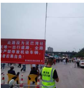
为了村民回家路通畅，社区干部在现场值守