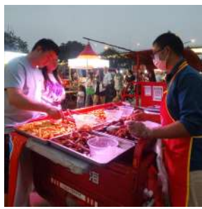
市民在夜市买小吃